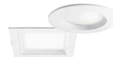
ELSA i et rundt eller kvadratisk kabinet

FLAT-sensorerne styrer ikke kun belysningen, men giver også rummets æstetik det rigtige lys – især i et harmonisk samspil med diskrete downlights som ELSA- eller STINA-modellerne fra ESYLUX.