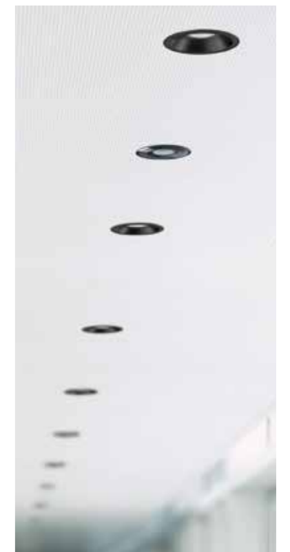
PD-FLAT 360i/8 GLASS ROUND BLACK, STINA 90