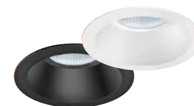
STINA fås i sort eller hvid