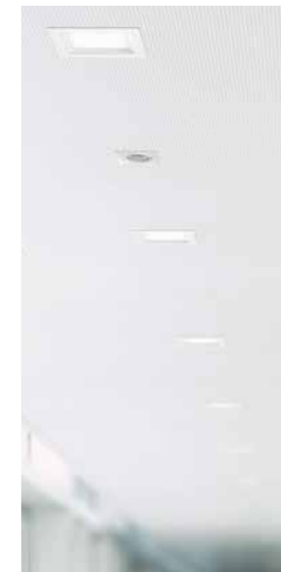
PD-FLAT 360i/8 GLASS SQUARED WHITE, ELSA 125