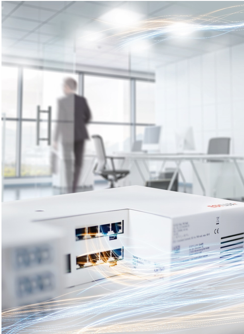
ESYLUX Light Control (ELC)